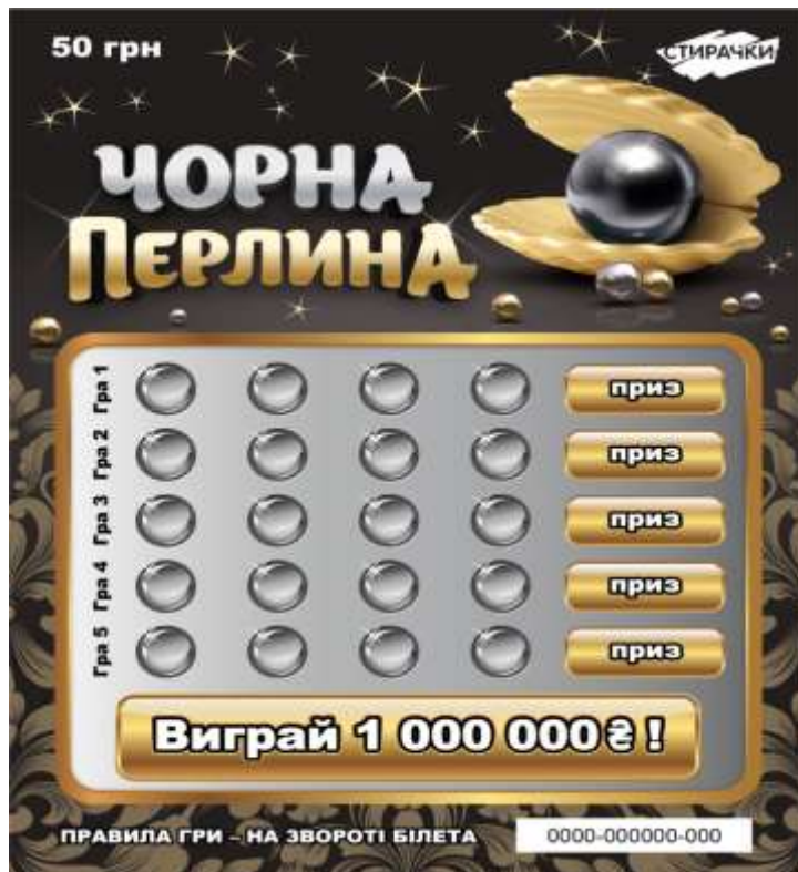
Лицьова сторона лотерейного білета